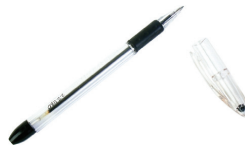
la pluma the pen