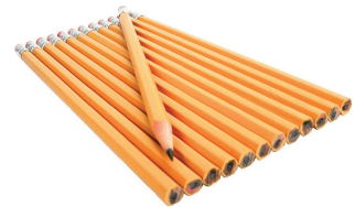
el lápiz the pencil