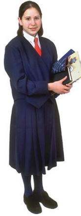
el, la profesora el, la maestra the teacher