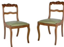
las sillas the chairs