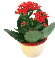
las flores the flowers