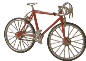
la bicicleta the bicycle