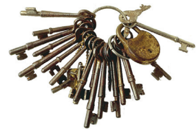
las llaves the keys