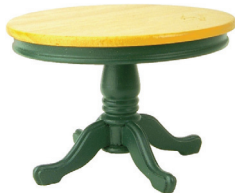
la mesa the table