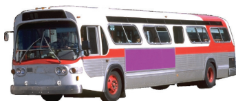
el autobús the bus