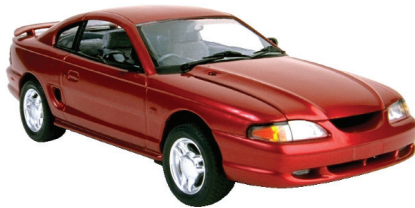
el auto the car