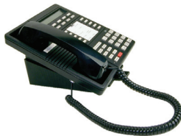
el teléfono the telephone