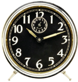
el reloj the clock